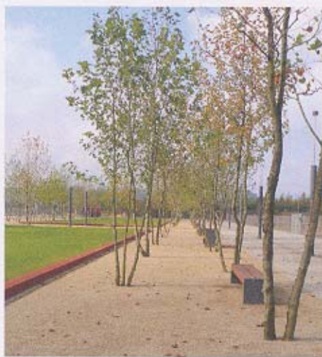
Meestammige bomen geven een natuurlijke en volle aanblik.

De ontwerpers zien bruikbare uitgangspunten in het industriële erfgoed, maar een deel is helaas al verwijderd op het moment dat de landschapsarchitecten ingeschakeld werden. Door behoud van een aantal overgebleven elementen willen zij een sfeer neerzetten die bij de plek past, met respect voor de cultuurhistorie en de natuur. De bestaande hoogtevverschillen geven bijvoorbeeld een kader voor de indeling van het plan in deelgebieden. De schoorstenen zijn een perfecte blikvanger, oude rails op metershoge betonnen pilaren vormen een bijzonder element en een speciale wagon is omgetoverd tot een uniek historisch kunstwerk op een plein.