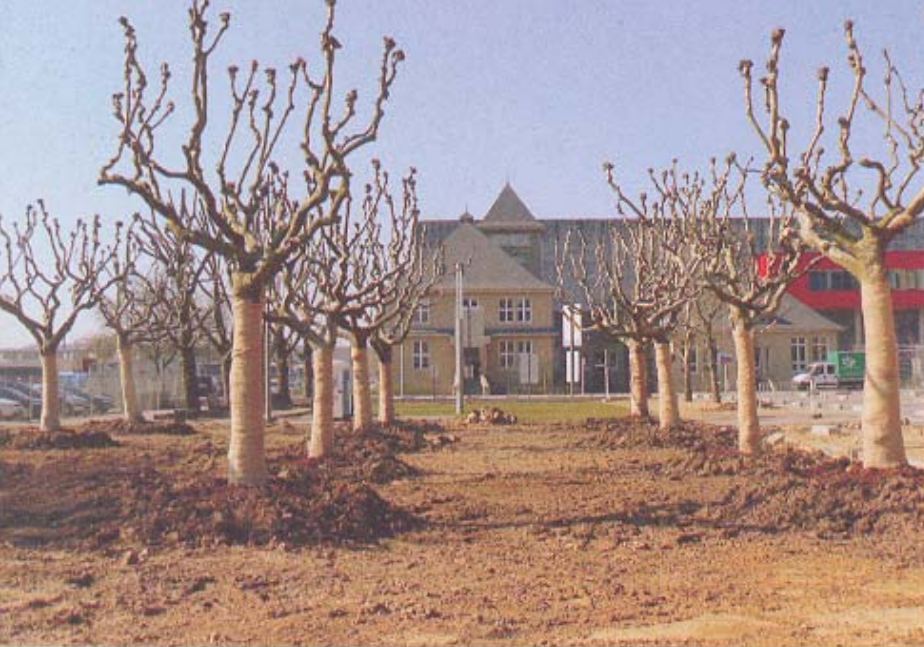
Platanen sieren reeds het staatsarchiefplein.

Een belangrijke basis van het plan is de Stad van de Wetenschap (Cité des Sciences). Hier moet de eerste universiteit van Luxemburg komen en verder veel openbare faciliteiten als een rockhal, hotel, bioscoop en een grote school. Square Mile wordt een hoogstedelijk gebied. Dat zal bestaan uit blokken van vijf verdiepingen hoog.